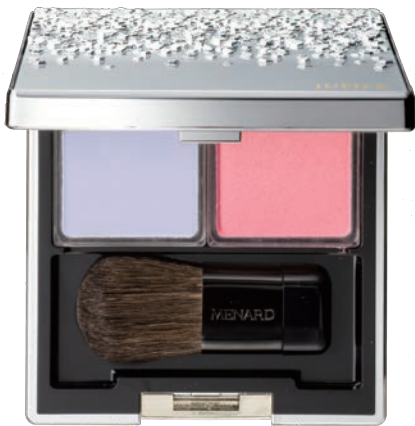
〈ジュピエル フェイスカラーコンパクト 7〉

新2セット〈7、8〉各5,000円(税込5,400円) 2018年 2月21日 発売