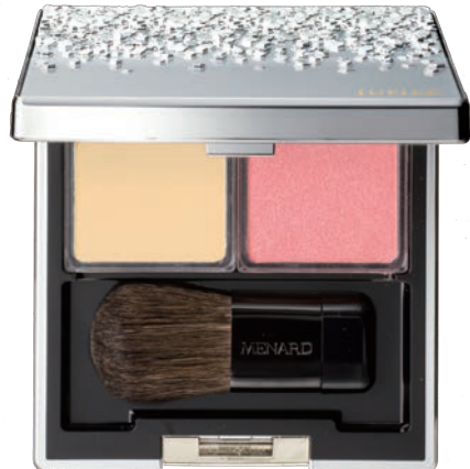
〈ジュピエル フェイスカラーコンパクト 8〉

左: 90C 〈ハイライトカラー〉 NEW くすみをほらい透明感を高めるパープル 右: 23F 〈チークカラー〉 甘くかわいらしいピンク