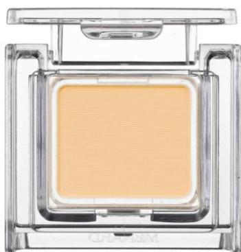
ジュピエル フェイスカラー<1色入> 60C

日本メナード化粧品株式会社（本社：名古屋市中区、代表取締役社長：野々川純一）は、 肌をクリアに見せ、自然な血色感と立体感を作り出す 『ジュピエル フェイスカラー<1色入>』より 新2色を2018年2月21日に発売します。