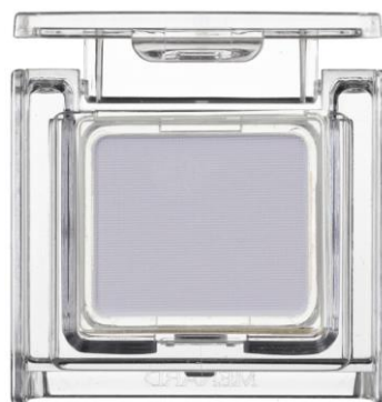
ジュピエル フェイスカラー<1色入> 90C