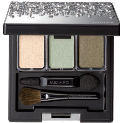
〈ジュピエル アイカラーコンパクト 8〉

左: M05F クリアな輝きを放つシルバー 中: N22F 大人の余裕を感じるやわらかなピンク NEW 右: N03G 輝きをもたらすグレー