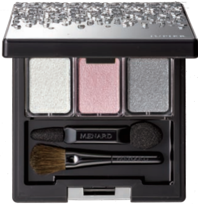
〈ジュピエル アイカラーコンパクト 7〉