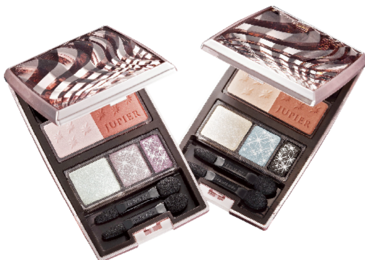
ジュピエル ビューティパレット 新2セット〈9、10〉 9,975円（税込） 2013年9月21日発売

日本メナード化粧品株式会社（本社：名古屋市中区丸の内3-18-15、代表取締役社長：野々川純一）は、 希望に満ちあふれた星空のような輝きと瞬きが私らしさを輝かせ 洗練感ある色とニュアンスで感じるままに楽しめる アイカラー&フェイスクラーをセットしたメイクアップパレット 『ジュピエル ビューティパレット』新2セットを2013年9月21日に発売します。