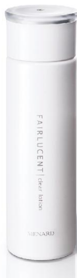
フェアルーセント クリアローション 160mL 5,250円（税込） 2013年4月21日発売

日本メナード化粧品株式会社（本社：名古屋市中区丸の内3-18-15、代表取締役社長：野々川純一）は、 「角質細胞の凸凹化」に着目し、洗顔後ふきとるだけのデイリーケアで 使うたび、透明感のあるなめらかな質感へと育て、 古い角質をやさしくとり、後に使う化粧品のなじみをよくする※ ローションタイプのふきとり美容液 『フェアルーセント クリアローション』を2013年4月21日に発売します。