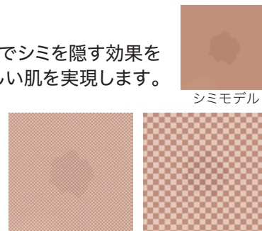
A.小さな格子柄 B.大きな格子柄

人がモノの色や形を認識する際、そのモノの輪郭がカギとなっています。輪郭を認識できないようにすれば、モノが見えにくくなります。右図を比較すると、シミの輪郭が見えやすいA図に対して、B図の方が目の錯覚効果でシミが目立ちません。このような効果に着目し、開発した粉体が光イリュージョンパウダーです。大きいサイズの無色のパール剤の表面に肌色の微細な粉体を付着させ、自然で美しい肌色に仕上げながら、シミの輪郭を見えにくくすることでシミを目立たせません。