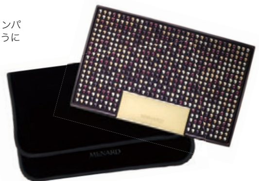
■画像、イラストはすべてイメージです。