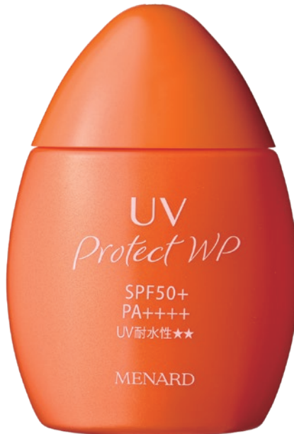
ウォータープルーフ UVプロテクトWP 50mL 3,000円（税込3,300円）

日本メナード化粧品株式会社（本社：名古屋市中区、代表取締役社長：野々川純一）は、快適な使用感で、キレイに仕上がる日やけ止めミルクローション「UVプロテクトWP」を2024年5月21日に発売いたします。