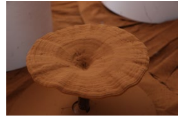
靈芝の傘に積もった靈芝孢子

メナードでは、芽吹きと成長のパワーが凝縮された植物の“起源”である種子について世界中を探索してきました。また、1980年代より、古くから有用であると言われてきた“靈芝”に着目し、栽培からエキス化、有効性評価を行い、様々な有用性を見出してきました。その靈芝の種子にあたる孢子にも、秘められた力があるのではと考え、“起源”の研究と“靈芝”の研究を融合させ、「靈芝孢子」に着目しました。靈芝孢子油は、靈芝孢子の殻に含まれる油性成分で、近年、研究が盛んに行われており、食品分野での応用が期待されている注目の成分です。「靈芝孢子油」が美容と健康維持に役立つことを新たに見出し、配合しました。