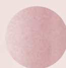
100 ピンク味のローズ