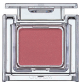
[ 14F ]