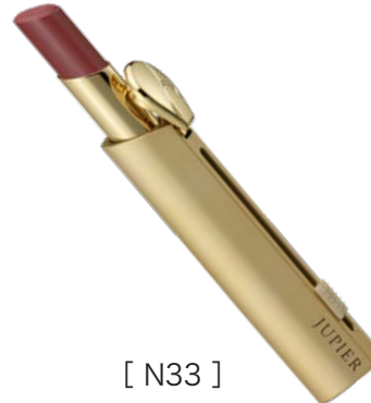
[ N33 ] 上品なレッドで 女性らしいくちびるに