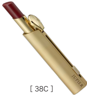
[ 38C ] クリアなカシスレッドで クールにつやめくちびるに

うるおいに満ちたつややかさと上品な輝きで 肌をクリアに見せる美しい発色が続く 片手で使えるワンタッチタイプのリップスティックから新2色が登場