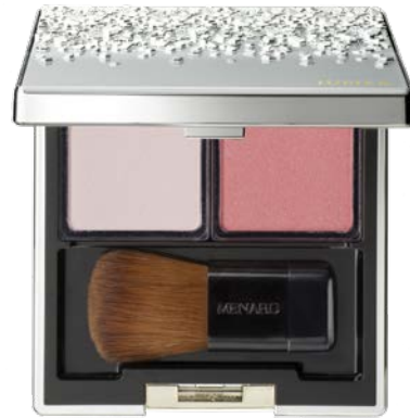
[ 14 ]

左:01 〈ハイライトカラー〉 みずみずしいツヤのあるホワイト 右:N12F 〈チークカラー〉 明るく透明感のあるローズ NEW