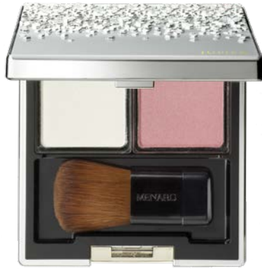
[ 13 ]

肌をクリアにみせ、顔立ちを美しく引き立てる チークとハイライトをセットしたフェイスカラーコンパクトに新2セットが登場