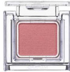
[ 33F ]