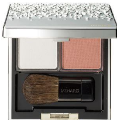
ジュピエル フェイスカラーコンパクト 6

オレンジのチークがメリハリのある骨格を引き立て、 ホワイトとのコントラストを作り出す