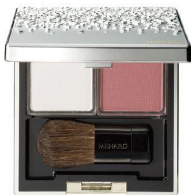
ジュピエル フェイスカラーコンパクト 5

日本メナード化粧品株式会社（本社：名古屋市中区、代表取締役社長：野々川純一）は、 血色とツヤを与えるチークカラーと明るさをプラスするハイライトがセットになった 『ジュピエル フェイスカラーコンパクト』より 新2セットを2017年9月21日に発売します。