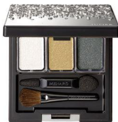
ジュピエル アイカラーコンパクト 6