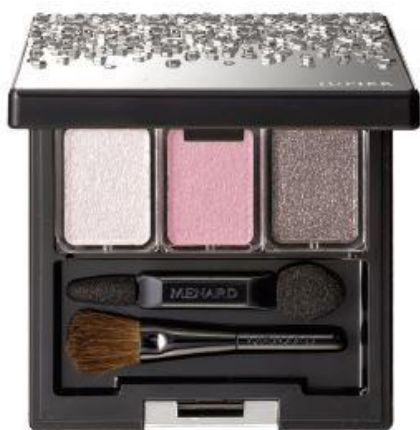
ジュピエル アイカラーコンパクト 5

日本メナード化粧品株式会社（本社：名古屋市中区、代表取締役社長：野々川純一）は、色と質感のレイヤードで目もとの印象を際立たせる3色のアイカラーがセットになった『ジュピエル アイカラーコンパクト』より新2セットを2017年9月21日に発売します。