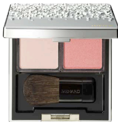
ジュピエル フェイスカラーコンパクト 4 ピンクのチークが明るく可憐な血色感を与え パールピンクがほんのり明るさをプラス

ジュピエル フェイスカラーコンパクト 新2セット〈3、4〉各9,500円（税込10,260円） 2017年2月21日発売