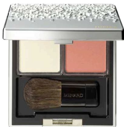
ジュピエル フェイスカラーコンパクト 3 オレンジのチークがいきいきとした血色感を与え オフホワイトが明るさをプラス

日本メナード化粧品株式会社（本社：名古屋市中区、代表取締役社長：野々川純一）は、 血色と輝きを与えるチークカラーと明るさをプラスするハイライトがセットになった 『ジュピエル フェイスカラーコンパクト』より 立体感を作り出し、大人の女性のスマイルを明るく彩る 新2セットを2017年2月21日に発売します。