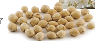
西洋実ザクラの種子