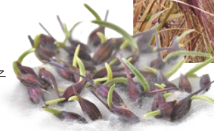
発芽した紫ムギの種子