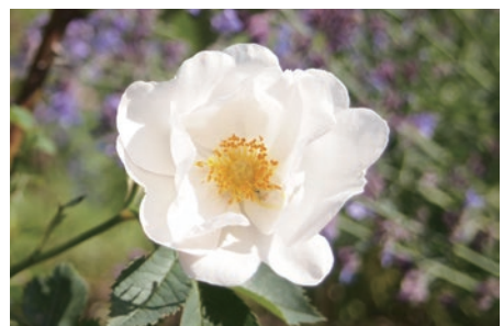
セミプレナローズ

生命の始まりに秘められている未知なる力を信じ、植物の種子や原種に近いものを探索し、研究してきた中でたどりついたのは、白バラの祖・アルバローズを代表するオールドローズである「セミプレナローズ」です。清らかな花容、青みを帯びた葉など、多くの人を魅了してやまない美しいバラであるセミプレナローズの茎と葉から抽出したエキスが肌の起源に働きかけ、美しさを生みつづけます。