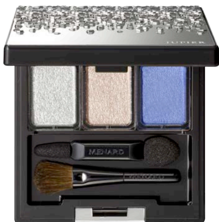
ジュピエル アイカラーコンパクト 3 メタリックな輝きとスキンベージュでつくる ソフトなメリハリをベースに ブルーのアクセントで 清んだまなざしへ

日本メナード化粧品株式会社（本社：名古屋市中区、代表取締役社長：野々川純一）は、色と質感のレイヤードで目もとの印象を際立たせる3色のアイカラーがセットになった『ジュピエル アイカラーコンパクト』より大人の女性のスマイルを美しく彩る新2セットを2017年2月21日に発売します。