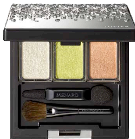
ジュピエル アイカラーコンパクト 4 ゴールドのキラメキをベースに フレッシュなライムイエロー&オレンジの彩りと質感で 輝くまなざしへ

ジュピエル アイカラーコンパクト 新2セット〈3、4〉 各9,500円（税込10,260円） 2017年2月21日発売